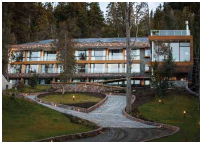
Apart Hotel Villa Trafal