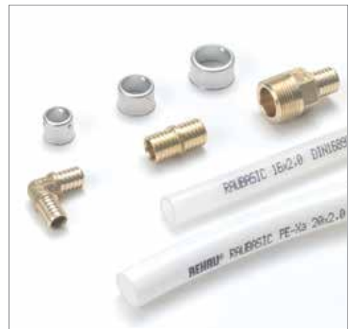
Componentes del sistema RAUBASIC