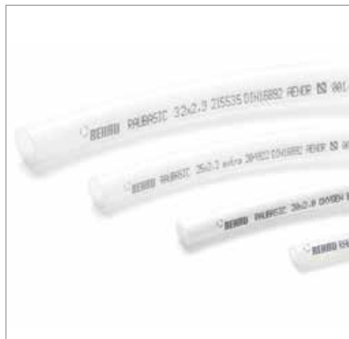
Simplemente la unión más confiable